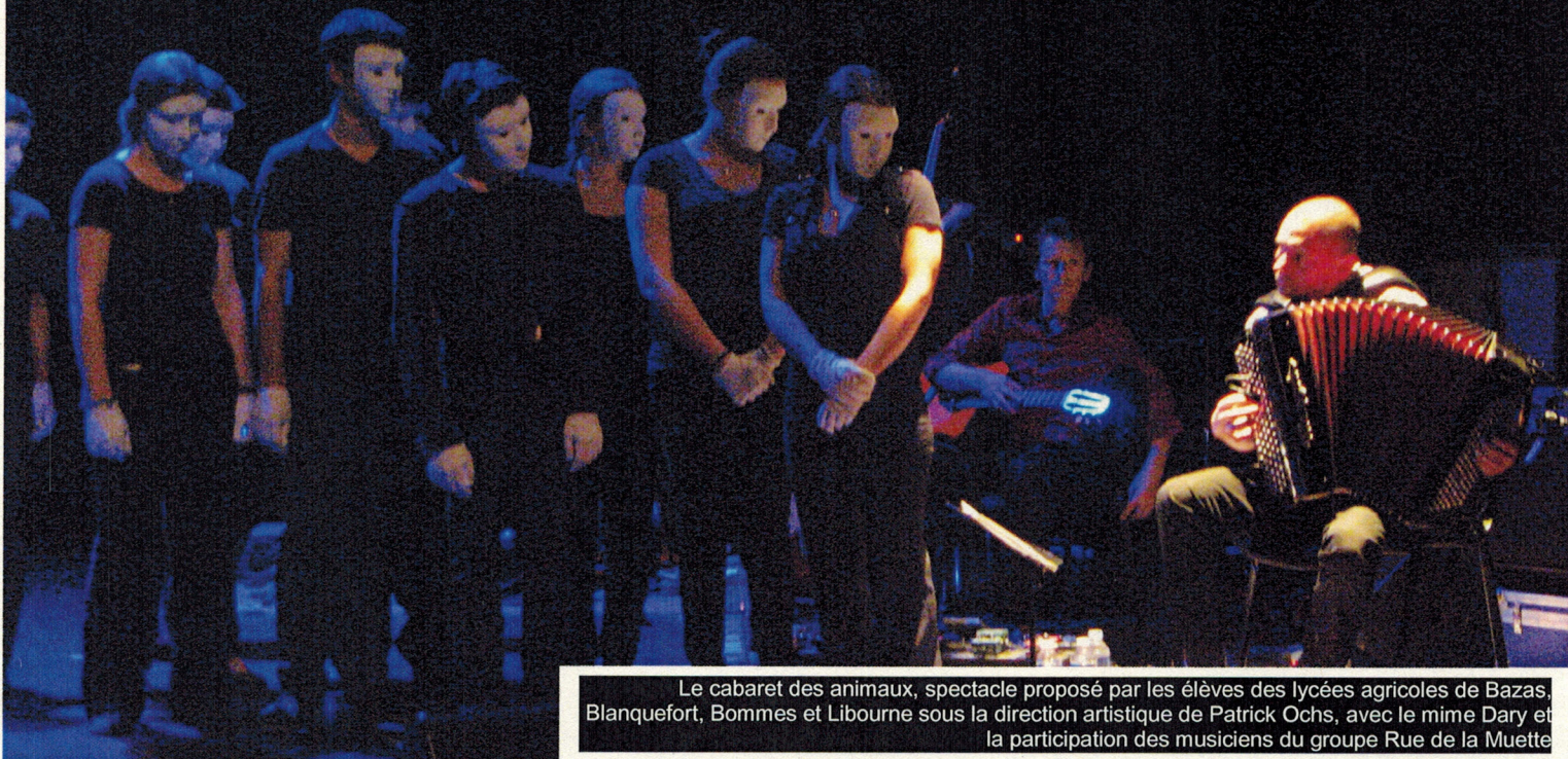
Le cabaret des animaux, spectacle proposé par les élèves des lycées agricoles de Bazas, Blanquefort, Bommes et Libourne sous la direction artistique de Patrick Ochs, avec le mime Dary et la participation des musiciens du groupe Rue de la Muette